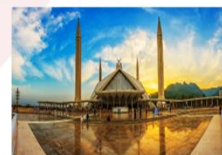
มัสยิดไฟซาล

DAY8 ตักศิลา-พิพิธภัณฑ์ตักศิลา-อิสลามาบัต-มัสยิดไฟซาล-Shopping-กรุงเทพ