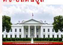
The White House

16.00 น. นำท่านเดินทางสู่สนามบินดัลเลส 21.45 น. ออกเดินทางสู่อิสตันบูล ประเทศตุรกี เที่ยวบิน TK8