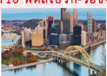
เมืองพิตส์เบิร์ก