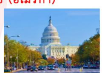
กรุงวอชิงตัน ดี.ซี.

** พักที่ Staybridge Suites Tysons McLean Hotel 4* หรือเทียบเท่า **