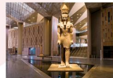
Grand Egyptian Museum