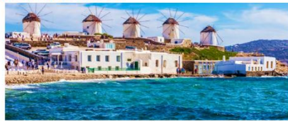
เกาะมิโคนอส

** พักที่ Camarades Hotel 4* หรือเทียบเท่า **