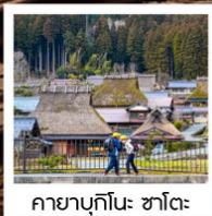
คายาบุกิโนะ: ซาโตะ