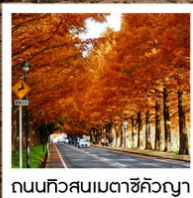
ถนนทิวสนเมตาชิคิวญา