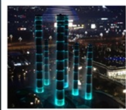
ห้างสรรพสินค้า SKP