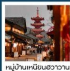
หมู่บ้านเหมียนฮวาชวน