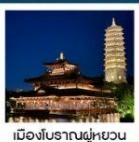
เมืองโบราณฝูหยวน