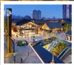
ถนนคนเดินไท่กู่หฺสี้