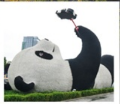
รูปปั้นแพนด้าเซลฟี่