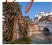
เมืองโบราณลี้เจียง