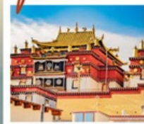
วัดลามะ:ซงจ่านหลิง