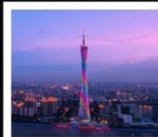
แคนตันทาวเวอร์