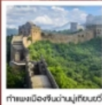
กำแพงเมืองจีนด้านมู่เทียนยวี่