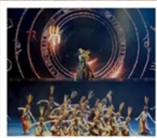
โชว์เว่ยชิว

เซี่ยงไฮ้ คลาสสิก ไนต์ (Shanghai Classic Night) หุบเขาเทวดาวังเซียนกู่ (ชมบรรยากาศกลางวันและกลางคืน) หมู่บ้านโบราณหวงหลิ่ง (รวมกระเช้าไปกลับ) สะพานกระจก ถนนโบราณกุนซี / โชว์การแสดงเว่ยชิว / หมู่บ้านโบราณเฉิงชาน ถนนหวยไห่ (ร้านกระเป๋าสองมอนต์) / เช็กเมนู 3 ตึกใหญ่แห่งเซี่ยงไฮ้ Tian An 1,000 Trees / North Bund Green Land / ถนนอู่กิง