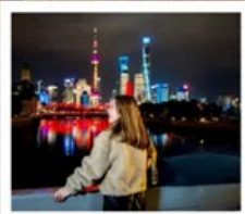
เซี่ยงไฮ้คลาสสิกไนท์