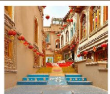
เมืองโบราณคิซาร์