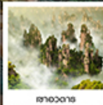
จางเจียเจีย