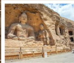
หยุนกิงสื่อคุ