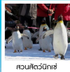
สวนสัตว์นิกเซ่

วัดคิตสึโอจิ / ปราสาทโอซาก้า / ย่านชินไซบาชิ ค่องเรือทะเลสาบโทยะ / โทริยวคะกุ ทาวเวอร์ โกดังอิฐแดงคานโมริ / นั่งกระเช้าภูเขาอาโอดาเตะ ตลาดเช้าเมืองฮาโอดาเตะ / สวนสัตว์นิกเซ่ มารินพาร์ค พิพิธภัณฑ์ค่องดนตรี / นาฬิกาไอน้ำโบราณ โรงเป่าแก้วคิตาอิชิ / เนินพระพุทธรเจ้า / มิซึย เอ้าเค็ทท์