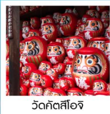
วัดคิตสึโอจิ