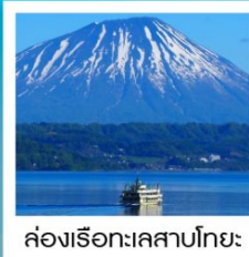
ค่องเรือทะเลสาบโทยะ