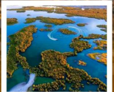
ทะเลสาบอูหลุนกู่

ผ่านทางด่วนทะเลทราย S21 / ทะเลสาบอูหลุนกู่ / ปู๋เอ๋อจิน / เซาโปซา / ทุ่งหญ้าอาเหอถังโก่ตี้ / หมู่บ้านเหมอู่ซุน / คานาสีอ / ทะเลสาบมังกรหลับ / ทะเลสาบเทวดา จุดชมวิวกานาสีอ / ศาลาชมปลา / ค่องเรือทะเลสาบคานาสีอ / หาดห้าสี / เมืองปีศาจ / เมืองคาลามาอี / คาลามาอี / แกรนด์แคนยอนตูซานจื่อ / ตลาดต้าปาจา