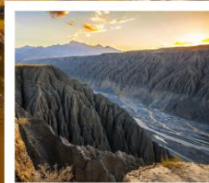
แกรนด์แคนยอนตูซานจื่อ