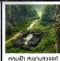
หลุมฝังศพพันสวรรค์