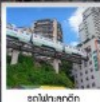
ตึกไฟฟ้าตงตง

ทัวร์คุณภาพ ไปลงร้านช้อปปิ้ง • ไปชായออฟชั่น