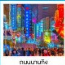
ถนนนานกิง