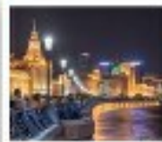
ทาโอ่วทาน