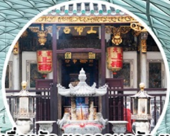
บู เรื่องรัก ขอบรรณครว ขอลูก Yueh Hai Ching Temple

ทัวร์สิงคโปร์ 3 วัน 2 คืน โดยสายการบิน Thai Lion Air (SL)