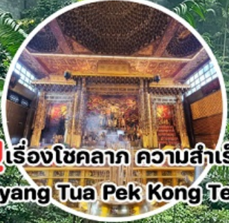
บู เรื่องโชคลาภ ความสำเร็จ Loyang Tua Pek Kong Temple