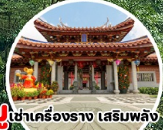
บู เข้าเครื่องราง เสริมพลัง Lian Shan Shuang Lin Temple