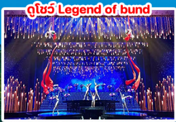
ดูโชว์ Legend of bund