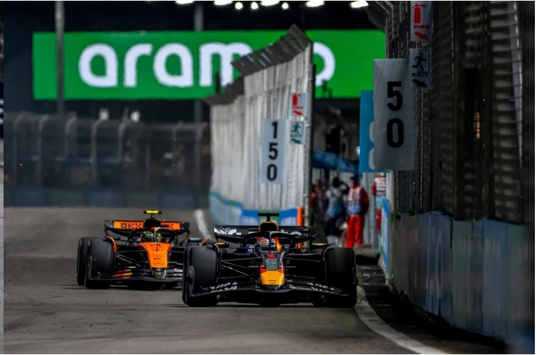
ชม รอบ SPRINT RACE + QUALIFYING