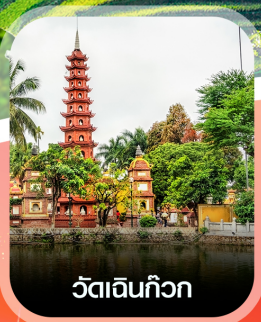
วัดอินทก๊วก

✈️ คอนเฟิร์มออกเดินทาง ทุกพีเรียด 2 ท่านขึ้นไป