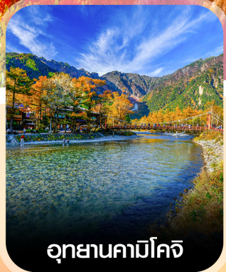
อุทยานคามิโคจิ