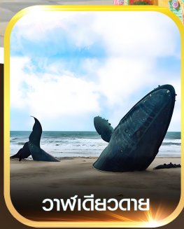
วาฬเดี่ยวตาย

สิงหาคม 69 - กุมภาพันธ์ 70 ราคาเริ่มต้น 22,899