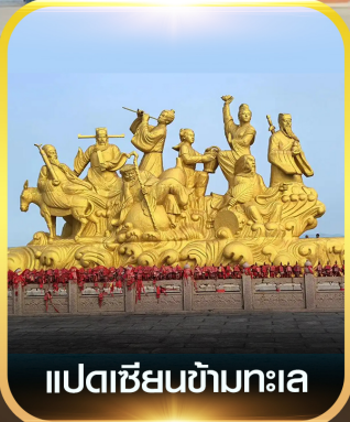
แปดเซียนข้ามทะเล