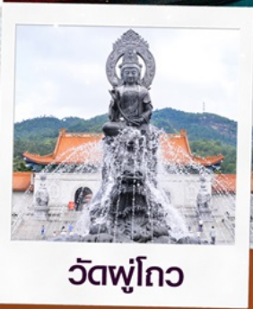
วัดพูโถว