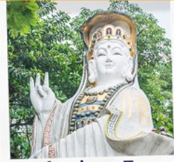
เจ้าแม่กวนอิม ริฟลิสเบย์