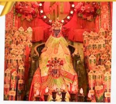
เจ้าแม่กวนอิมฮ่องกง

โรงแรม Eaton Hotel และ iclub Mong Kok Hotel