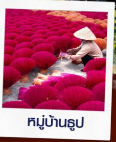
หมู่บ้านรูป