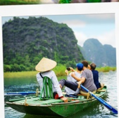
ล่องเรือ Tamcoc