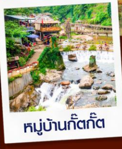
หมู่บ้านก๊ตก๊ต