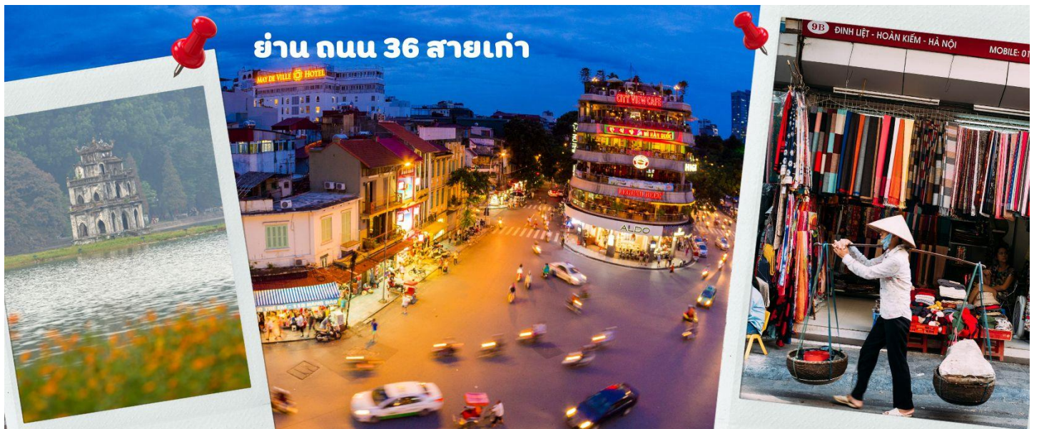
ย่าน ถนน 36 สายเก่า

จากนั้นให้ท่านได้ อิสระช้อปปิ้ง ถนนสาย 36 street แหล่งช้อปปิ้งของฮานอย มีต้นไม้ปกคลุมสองฝั่งถนน สาเหตุที่ชื่อถนน 36 มาจาก 36 อาชีพที่ทำการค้าขายบนถนนแห่งนี้ ตั้งแต่อดีตอย่างงานด้านหัตถกรรมสอดคล้องกับชื่อถนนแต่ปะเล้น ในอดีตอย่าง เครื่องเงิน ผ้าไหม บนถนนแห่งนี้ แต่ปัจจุบันมากกว่า 36 ไปแล้ว ที่นี้จะเป็นแหล่ง Shopping มีสินค้าเกือบทุกชนิด ร้านขายชุดกีฬามีทุกแบรนด์เพราะที่นี้เป็นแหล่งผลิตให้หลาย ๆ แบรนด์