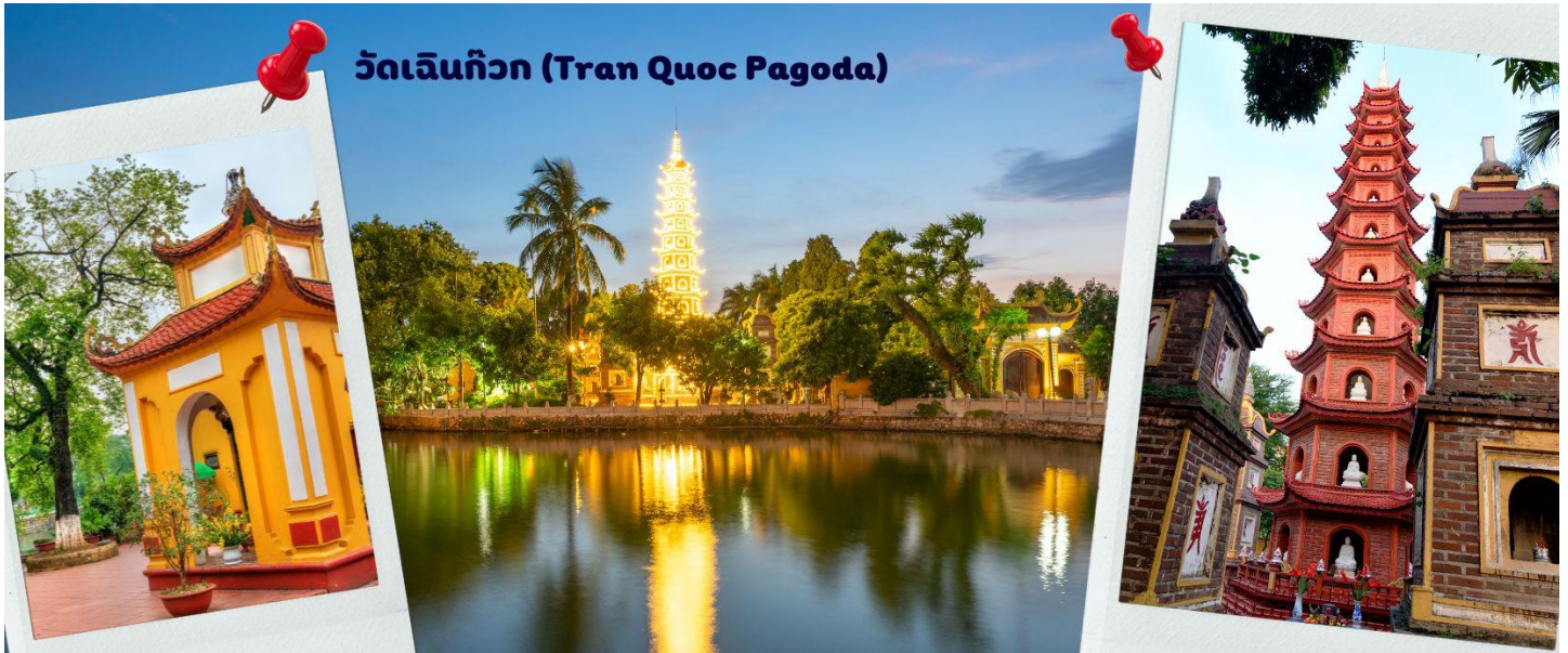
วัดเจดีย์กว (Tran Quoc Pagoda)

ผังเป็นอย่างดี ใช้สีสันทึกลมกลืนในโทนสีเหลือง น้ำตาล ตัดกับสีเขียวของต้นไม้ใหญ่ที่โอบล้อมอยู่ในมุมถ่ายภาพจากอีกฝั่งหนึ่ง จะเห็นสิ่งปลูกสร้างสไตล์จีน และเจดีย์หลายชั้นโดดเด่น มีภาพที่สะท้อนลงสู่ผิวน้ำ เป็นภูมิทัศน์ที่งดงามทั้งยามกลางวันและยามค่ำคืนที่มีการเปิดไฟส่องสว่าง