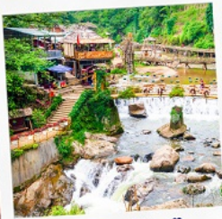
หมู่บ้านก๊ตก๊ต