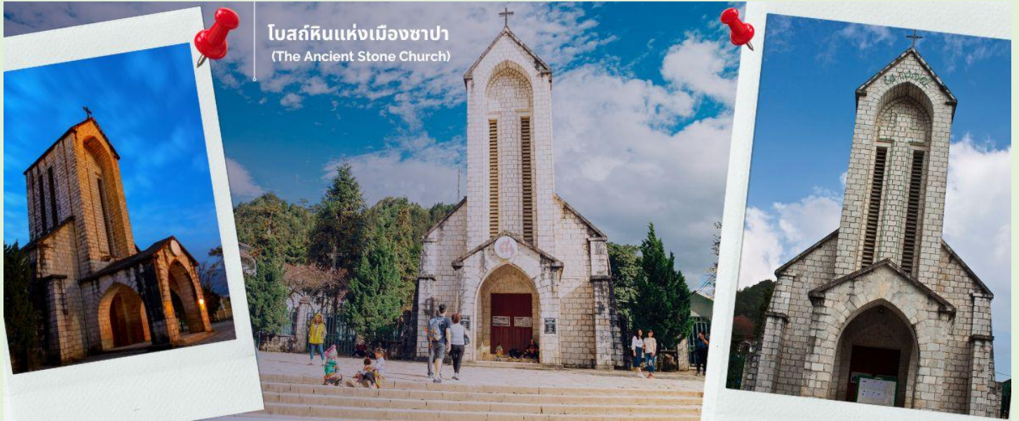
โบสถ์หินแห่งเมืองซาปา (The Ancient Stone Church)

นำท่านช้อปปิ้งที่ ตลาดไนต์เมืองซาปา มีสินค้าให้ท่านเลือกช้อปปิ้งมากมาย ไม่ว่าจะเป็นสินค้าพื้นเมืองของฝัก ขนม กระเป๋า รองเท้า ท่านสามารถช้อปปิ้งได้อย่างจุใจ