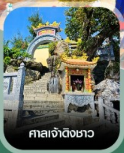
ศาลเจ้าดิ้งซา

เช็อินสวนสนุก VinWonders ใหญ่ที่สุดของเวียดนาม นั่งกระเช้าชมวิวข้ามทะเล สวนสนุกฮอนเท็ม ตื่นตาอควาเรียมรูปเต่า อาณาจักรสัตว์น้ำ