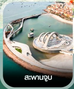
สะพานจูบ

✈️ คอนเฟิร์ม ออกเดินทาง ทุกพีเรียด 2 ท่านขึ้นไป