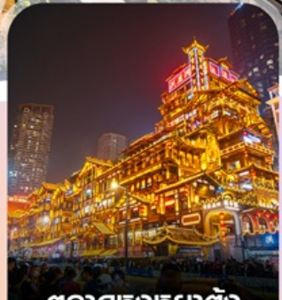
ตลาดหงหย่าตั้ง