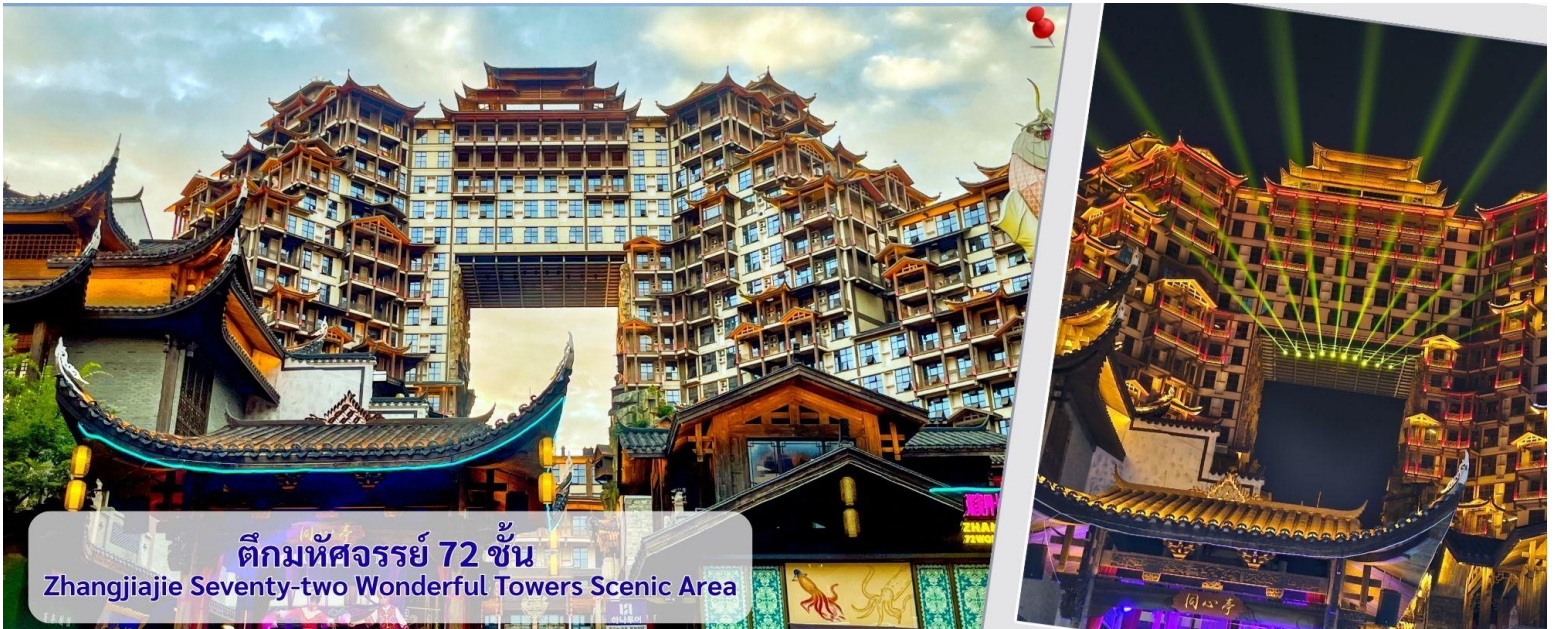
ตึกมหัศจรรย์ 72 ชั้น Zhangjiajie Seventy-two Wonderful Towers Scenic Area

ให้ท่านได้แวะชมสินค้าผลิตภัณฑ์จากร้านยางพารา จากนั้นนำทุกท่านชมชมตึกมหัศจรรย์ 72 ชั้น จุดเช็คอินใหม่ล่าสุด ของเมืองจางเจี๋ยเจี๋ย โดยการสร้างตึกในครั้งนี้เป็นการรวมเอาจุดเด่นของเมืองจางเจี๋ยเจี๋ยกับวัฒนธรรมการสร้างบ้านเรือน ของชาวพื้นเมืองถู่เจี๋ยมารวมกันโดยอาคารสูงที่สร้างจำลอง เขาเทียนเหมินซานหรือประตูสวรรค์ และ บ้านยกพื้นโบราณที่ เป็นบ้านพื้นเมืองของชาวถู่เจี๋ย ภายในบริเวณตึก 72 ชั้น ยังรวบรวม รีสอร์ท ร้านอาหาร สตรีทฟู้ด ร้านขายของที่ระลึก ที่ ตกแต่งด้วยแสงสีสุดอลังการ ตั้งอยู่ใจกลางเมืองจางเจี๋ยเจี๋ย