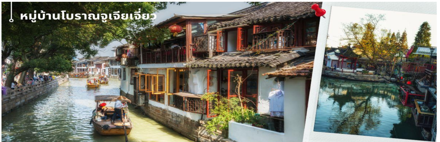
หมู่บ้านโบราณจูเจียเจี๋ย

📍รับประทานอาหารกลางวัน ณ ภัตตาคาร (4) เมนูพิเศษ ขาหมูร่ำรวย