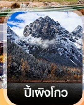
ปีเพิงโกว

✈️ คอนเฟิร์ม ออกเดินทาง ทุกพีเรียด 2 ท่านขึ้นไป ✈️