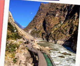
ช่องแคบเสือกระโจน รวมบันไดเลื่อน ขึ้น-ลง