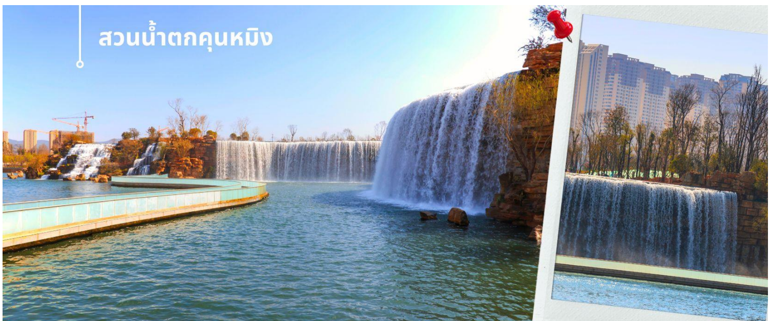
สวนน้ำตกคุณหมิง

นำท่านเดินทางสู่ สวนน้ำตกคุณหมิง เป็นสวนสาธารณะใจกลางเมืองคุณหมิง ถือเป็นสถานที่ท่องเที่ยวแห่งใหม่และเป็นที่พักผ่อนหย่อนใจยอดฮิตของชาวเมืองคุณหมิง ที่สร้างขึ้นด้วยฝีมือมนุษย์ น้ำตกแห่งนี้เป็นส่วนหนึ่งของโครงการผันน้ำจากแม่น้ำหนู่หลาน ให้เข้าสู่ทะเลสาบเตียนซี น้ำตกแห่งนี้มีความสูง 12.5 เมตร ยาว 400 เมตร ใช้เวลาสร้างเกือบ 3 ปี