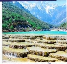
ทะเลสาบธารน้ำขาว รวมรถแท็กซี่