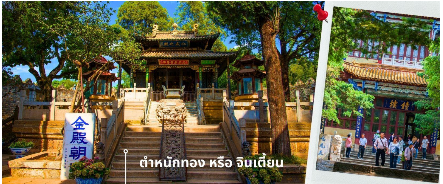
ต้าหนักทอง หรือ จินเตี้ยน

นำท่านเยี่ยมชม ต้าหนักทอง หรือ จินเตี้ยน (The Golden Temple Park | Jindian park) (ไม่รวมค่ารถแบตเตอรี่ 10 หยวน/ท่าน) โบราณสถานสำคัญของมณฑลยูนนาน ที่ได้รับการปกป้องดูแลโดยรัฐบาลจีน ตั้งอยู่บริเวณเชิงเขาหมิงเฟิง ล้อมรอบด้วยแนวกำแพงและหอคอยเหมือนเป็นป้อมปราการ ต้าหนักทองถูกเรียกตามลักษณะอาคารที่มีสีทองอร่าม จากทองเหลืองในส่วนของผนังและหลังคา รวมกว่า 200 ตัน โดยถือเป็นสิ่งปลูกสร้างสัมฤทธิ์ที่ใหญ่ที่สุดของจีน ภายในมีรูปปั้นทองโดยมีเงินอยู่ (เสวียนอู่) เทพเจ้าลัทธิเต๋าเป็นองค์ประธาน