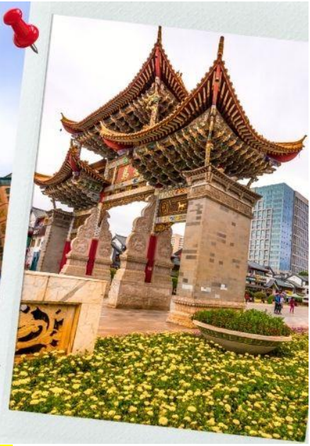
ประตูม้าทองไก่หยก Golden Horse Jade Cock Gate

เที่ยง ☉ รับประทานอาหารกลางวันที่ภัตตาคาร (14) เมนูพิเศษ สุกี้เห็ดไถดำ