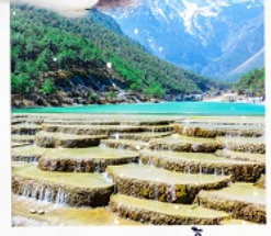
ทะเลสาบธารน้ำขาว รวมรถแบตเตอรี่