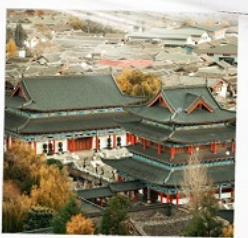
เมืองเก่าลี่เจียง