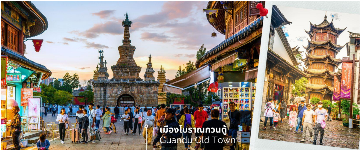
เมืองโบราณกวนตุ๋ Guandu Old Town

นำท่านชมบรรยากาศ เมืองโบราณกวนตุ๋ (Guandu Old Town) เป็นหนึ่งในต้นกำเนิดของวัฒนธรรมยูนนาน และยังถือเป็นหนึ่งในภูมิทัศน์ทางประวัติศาสตร์และวัฒนธรรม ที่สำคัญของเมืองคุนหมิง เมืองโบราณแห่งนี้ยังคงเป็นศูนย์กลางทางการค้าและคมนาคมที่สำคัญ ในอดีตเคยเป็นหมู่บ้านชาวประมงในสมัยราชวงศ์ถัง เมืองกวนตุ๋ยังเป็นเมืองแรกๆ ที่ศาสนาพุทธทางนิกายตันตระได้เริ่มเผยแพร่เข้ามาในดินแดนยูนนาน