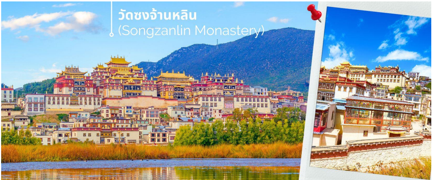
วัดซงจ้านหลิน (Songzanlin Monastery)

นำท่านชม วัดซงจ้านหลิน เป็นวัดลามะที่ใหญ่ที่สุดของมณฑล ยูนนานทางภาคตะวันตกเฉียงใต้ของจีน ถูกสร้างขึ้นในปีค.ศ.1679 อยู่ห่างจากตัวเมืองแซงกรี่ล่า 5 กิโลเมตร วัดนี้เป็นอีกหนึ่งสถานที่ท่องเที่ยวที่สำคัญของเมืองแซงกรี่ล่า ประเทศจีน ถ้ามาเที่ยวแซงกรี่ล่าแล้วไม่ได้แวะมาวัดซงจ้านหลินก็ถือว่ายังไม่ถึงแซงกรี่ล่า ด้านนอกวัดสามารถถ่ายรูปได้ แต่ภายในอาคารวัดห้ามถ่ายรูป