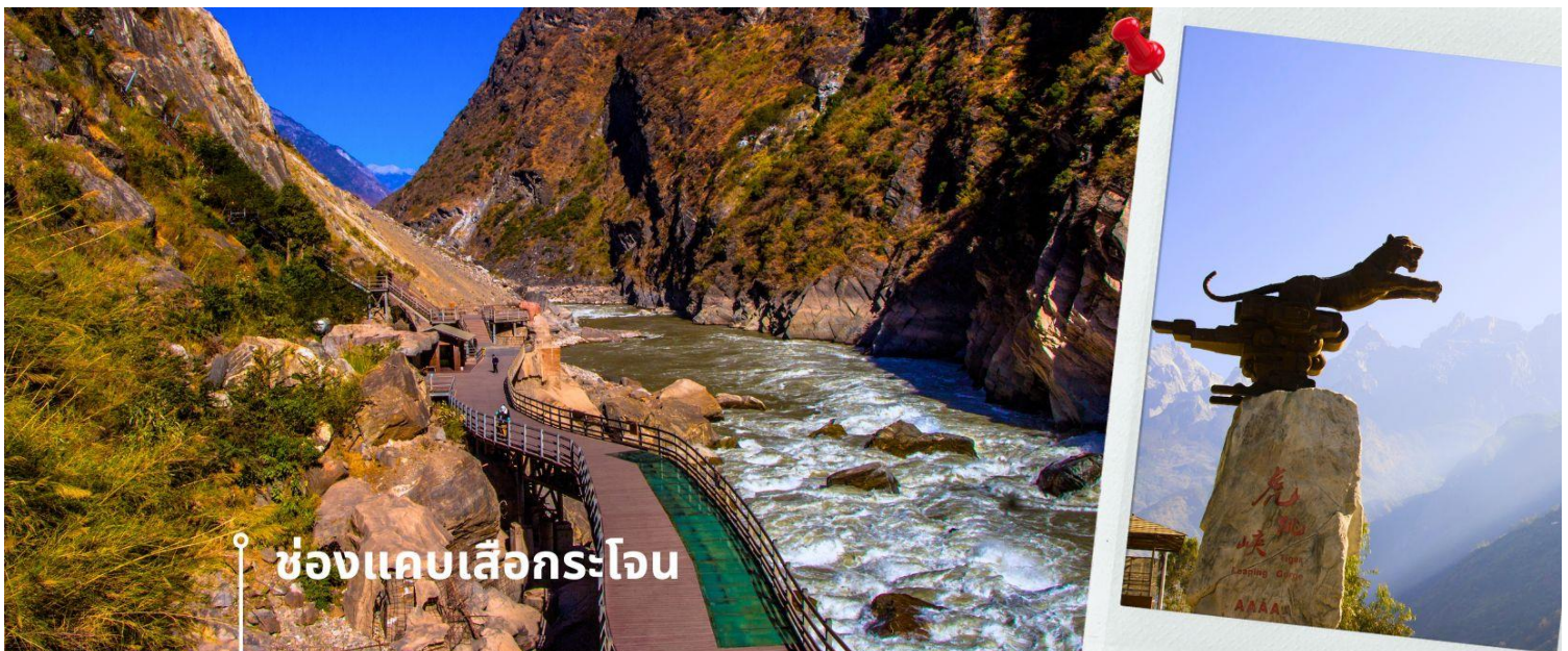
ช่องแคบเสือกระโจน

นำท่านแวะชม ช่องแคบเสือกระโจน (รวมค่าบริการบันไดเลื่อน ขึ้น-ลง) ซึ่งเป็นช่องแคบช่วงแม่น้ำแยงซีไหลลงมาจากจินซาเจียง(แม่น้ำทรายทอง) เป็นช่องแคบที่มีน้ำไหลเชี่ยวมาก ช่วงที่แคบที่สุดประมาณ 30 เมตร ตามตำนานเล่าว่า ในอดีตช่องแคบนี้สามารถกระโดดข้ามไปยังฝั่งตรงข้ามได้ จึงเป็นที่มาของ “ช่องแคบเสือ