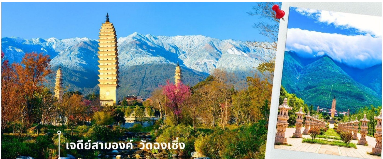
เจดีย์สามองค์ วัดจงเซิ่ง

จากนั้นผ่านชม เจดีย์สามองค์ สัญลักษณ์ของเมืองต้าหลี่ ตั้งอยู่ภายใน วัดจงเซิ่ง (Chongsheng Temple) วัดเก่าแก่ที่สร้างขึ้นเมื่อศตวรรษที่ 9 นับว่าเป็นหนึ่งในเจดีย์ที่สูงที่สุดในประเทศจีน อีกทั้งยังมีความศักดิ์สิทธิ์เป็นอย่างมาก ว่ากันว่าเป็นหนึ่งในสิ่งก่อสร้างเพียงไม่กี่แห่งที่ไม่ถูกทำลายจากเหตุการณ์แผ่นดินไหวในเมืองต้าหลี่เมื่อปี ค.ศ. 1925 จึงกลายเป็นสถานที่เคารพศรัทธาของชาวต้าหลี่เป็นอย่างมาก