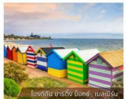
โบสถ์ต้น บาร์ดิง บิชอป, เมลเบิร์น