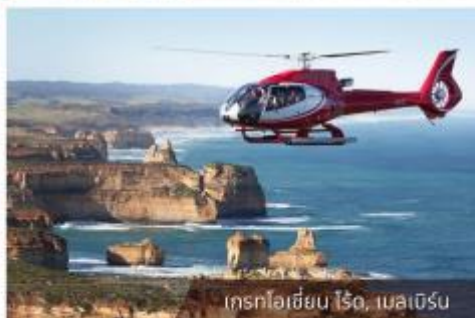
เที่ยวไฮซีม ไรโซ, เมลเบิร์น