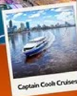
Captain Cook Cruises