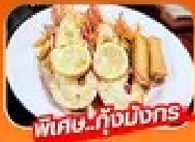
พิเศษ! กุ้งมังกร