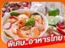
พิเศษ! อาหารไทย

1 - 5 เม.ย. / 29 เม.ย. - 3 พ.ค. 69 27 - 31 พ.ค. 69