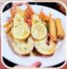
คุณลิซจะเสิร์ฟอาหารเช้า