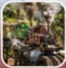
รถไฟจักรไฮม์น้ำโบราณ