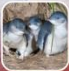
ชมเพนกวินที่เกาะฟิลลิป