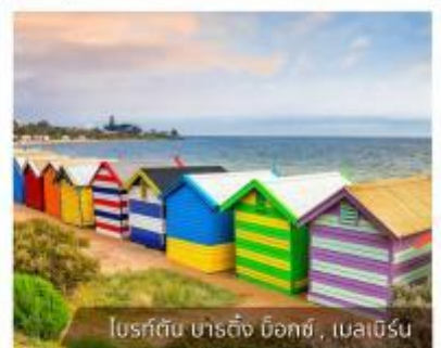
ไรต์ตัน บาร์ติง บิชอป, เมลเบิร์น