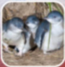
ชมพวงวันทีเกาะฟิลลิป