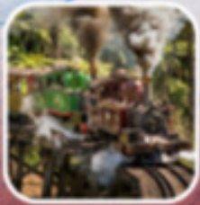
รถไฟจักรไอซ์เบิร์กโบราณ