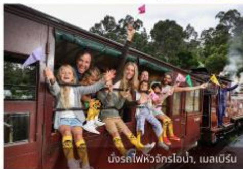
บั้งรถไฟหัวจักรไอน้ำ, เมลเบิร์น