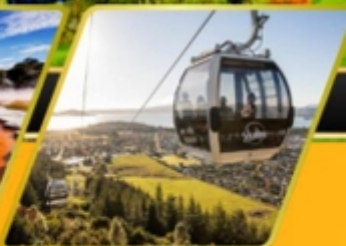
นั่งกระเช้ากอนโดล่าเมืองโรโตรัว