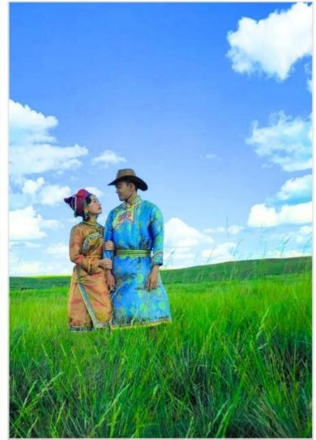
พิเศษ...เปลี่ยนชุดเป็นชุดมองโกลโบราณ

พิเศษ...เปลี่ยนชุดเป็นชุดมองโกลโบราณเพื่อเก็บภาพ ความทรงจำสุดประทับใจ (รวมค่าชุดแล้ว)