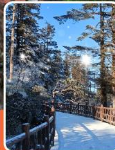
ภูเขาหว่าอูซาน