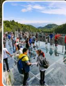
ระเบียงแก้วอุ๋หลง