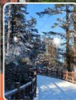
ภูเขาหวาอูซาน