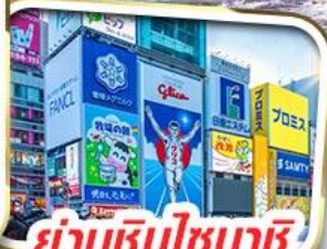
ย่านชินไซบาชิ

ราคาเริ่มต้น 29,999 *รวมภาษีมูลค่าเพิ่มแล้ว*