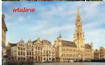
กรังปลาต