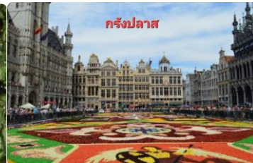
กรังปลาต