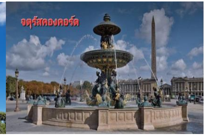
จัตุรัสคองคอร์ด

เที่ยง อิสระอาหารเพื่อมีเวลาในการช้อปปิ้งอย่างเต็มที่ บ่าย นำท่านออกเดินทางสู่ กรุงบรัสเซล ประเทศเบลเยียม ค่ำ รับประทานอาหารค่ำ ณ ภัตตาคาร ที่พัก HOLIDAY INN HOTEL หรือเทียบเท่า