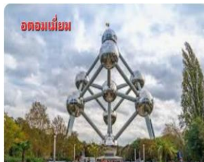
อะตอมเมียม

เช้า รับประทานอาหารเช้า ณ ห้องอาหาร โรงแรม นำท่านเข้าสู่ ย่านเมืองเก่ากรุงบรัสเซล ณ จัตุรัสกรังปลาต(GRAND PALACE) จตุรัสที่สวยงามมากๆ ซึ่งมีศาลาว่าการ ตัวอาคารต่างๆที่งดงามรายล้อมบริเวณจัตุรัส และให้ท่านได้ถ่ายรูปกับ เมนเน เก็นพิส(หนูน้อยยีนนี่) สัญลักษณ์เบลเยียม และ ช็อคโกแลตแสนเมดที่มีชื่อเสียงไปทั่วโลก จากนั้น นำท่านเดินทางสู่ สัญลักษณ์อีกอย่างของเบลเยียมนั่นคือ อะตอมเมียม สัญลักษณ์งานเอ็กซ์โปอัน ยิ่งใหญ่ของประเทศนี้