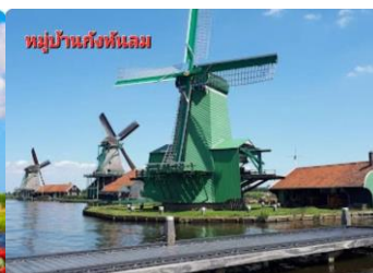
หมู่บ้านกังหันลม