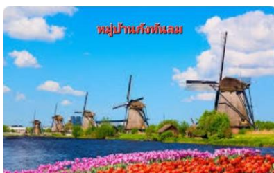
หมู่บ้านกังหันลม

เที่ยง รับประทานอาหารกลางวัน ณ ภัตตาคาร บ่าย นำท่านเดินทางสู่ เมืองโวเลนดัม(หมู่บ้านชาวประมง) ท่านจะได้พบกับความงดงามของหมู่บ้านนี้แบบไม่ มีลิ้มเลียน ซึ่งตั้งอยู่บนถนนที่เรียกว่า HEVEN STREET ให้ท่านได้ถ่ายรูปเก็บไว้เป็นที่ระลึก ....นำ ท่านเดินทางสู่ หมู่บ้านซานสคาน(หมู่บ้านกังหันลม) ให้ท่านได้ถ่ายรูปสัญลักษณ์ของประเทศ เนเธอร์แลนด์เก็บไว้เป็นที่ระลึก