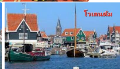
โวเลนดัม

เที่ยง รับประทานอาหารกลางวัน ณ ภัตตาคาร บ่าย นำท่านเดินทางสู่ เมืองโวเลนดัม(หมู่บ้านชาวประมง) ท่านจะได้พบกับความงดงามของหมู่บ้านนี้แบบไม่ มีลิ้มเลียน ซึ่งตั้งอยู่บนถนนที่เรียกว่า HEVEN STREET ให้ท่านได้ถ่ายรูปเก็บไว้เป็นที่ระลึก ....นำ ท่านเดินทางสู่ หมู่บ้านซานสคาน(หมู่บ้านกังหันลม) ให้ท่านได้ถ่ายรูปสัญลักษณ์ของประเทศ เนเธอร์แลนด์เก็บไว้เป็นที่ระลึก