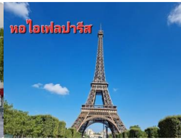
หอไอเฟลปารีส