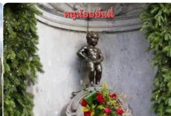
ทูนโยยีนนี่