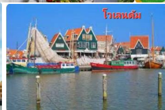
โวเลนดัม