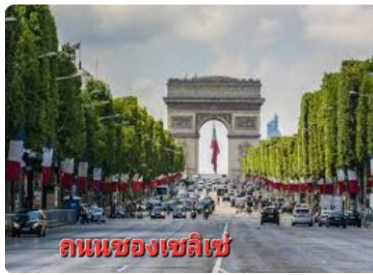
ถนนของเซลิเซ่