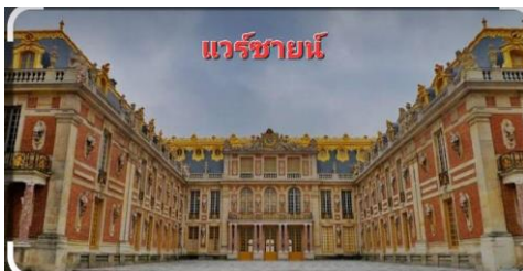
แวร์ซายน์

นำท่าน เข้าชมพระราชวังแวร์ซายส์ (VERSAILLES) (เข้าแบบ VIP ไม่ต้องต่อคิวรอนาน มีไกด์ท้องถิ่น บรรยาย ) สัมผัสความยิ่งใหญ่อลังการของพระราชวังที่ได้รับการยกย่องว่าใหญ่โตมโหฬารและสวยงามที่สุดในโลก ซึ่งได้รับการตกแต่งไว้อย่างหรูหราวิจิตรบรรจง ชมความงดงามของห้องต่างๆ ที่มีเอกลักษณ์เฉพาะตกแต่งประดับประดาด้วยภาพเขียนต่างๆและเฟอร์นิเจอร์ชั้นดี เช่น ห้องอพอลโล, ห้องนโปเลียน, ห้องบรรทมของราชินี, ห้องโถงกระจกท้องพระโรง, ห้องสงคราม และห้องสันติภาพ ฯลฯ ซึ่งรวบรวมเรื่องราวและความเป็นมาในอดีตอันยิ่งใหญ่ของพระราชวังแห่งนี้