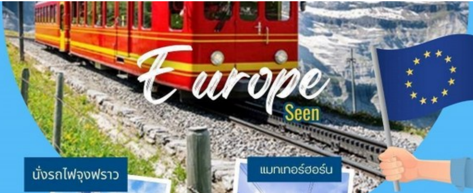
นั่งรถไฟจุ่งฟราว