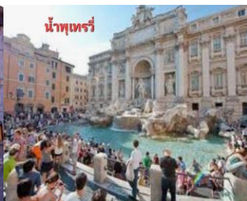
น้ำพุเทร่