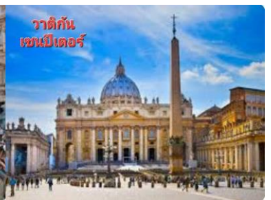
วาติกัน เซนต์ปีเตอร์

บ่าย ...ชม น้ำพุเทร่ จุดกำเนิดของเสียงเพลง ทรีคอยน์ออฟเดอะฟาวด์เท่น ที่โด่งดัง ชมความสวยงามของงานประติมากรรมหินอ่อนแบบบาร็อก ซึ่งเป็นเรื่องราวของเทพมหาสมุทร ตามตำนานกล่าวไว้ว่าหากใครได้มาถึงน้ำพุแห่งนี้แล้วโยนเหรียญ