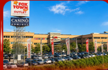
ฟ็อกซ์ทาวน์ เวก์เลีย